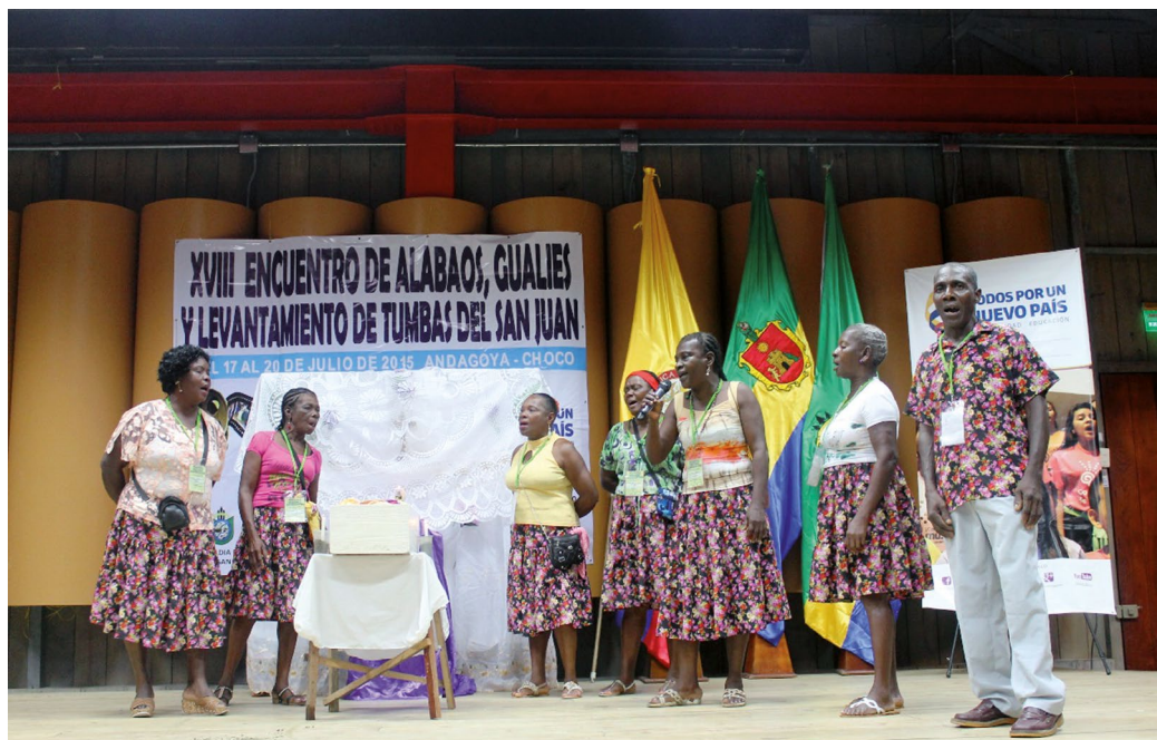
Cantaoras de alabaos, gualíes y levantamientos de tumba del Medio San Juan, 2015 (Jaime Acuña Lezama)

Por su parte, el levantamiento de tumba es una práctica que se realiza el último día de la novena. “La novena comienza el mismo día del entierro y dura nueve días. El último día es el más solemne y de mayor concurrencia. Los primeros ocho días el personal se reúne a las seis de la tarde después de los rezos especiales, permanecen allí hasta casi media hora después. Esta costumbre se mantiene sobre todo en el campo, pues en las zonas urbanas una vez terminado el rezo las personas se van a sus casas” (Ministerio de Cultura y Fundación Cultural de Andagoya 2014).