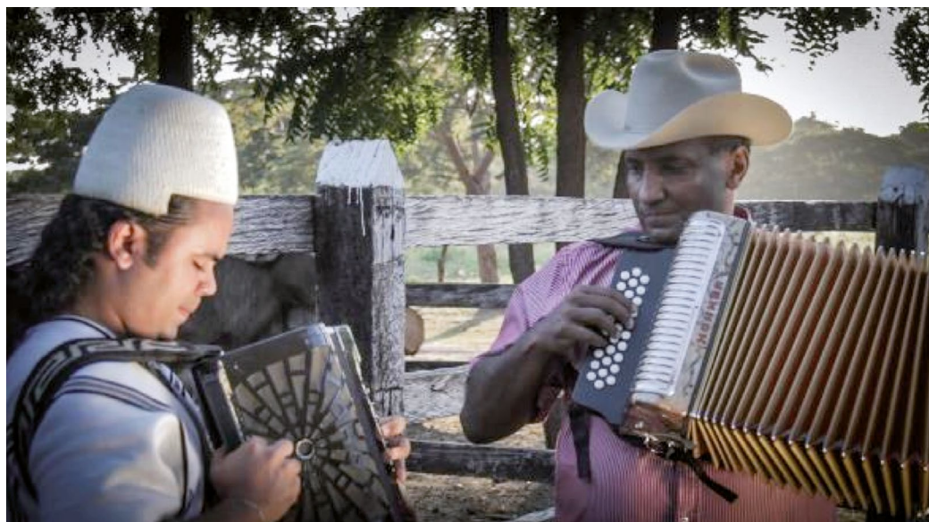
Juglares vallenatos, 2014 (Felipe Paz)

La música tradicional vallenata es un género musical cantado propio de la región Caribe del norte de Colombia, que nace de la conjugación de expresiones culturales diversas: los cantos de vaquería y los cantos responsoriales de los campesinos y esclavos negros durante el periodo colonial; las músicas de gaitas y maracas junto con las expresiones dancísticas de los indígenas nativos de la costa del Caribe colombiana; y el aporte del lenguaje textual y los instrumentos musicales europeos, entre los que se destaca el acordeón diatónico. Este último es el líder de la identidad musical vallenata y es acompañado rítmicamente por la guacharaca, de origen indígena, y por la caja, un tambor de origen africano. Así se da paso a la creación de cuatro aires rítmicos: el paseo, el merengue, la puya y el son que caracterizan el vallenato tradicional (Ministerio de Cultura y Clúster de la cultura y la música vallenata 2014).