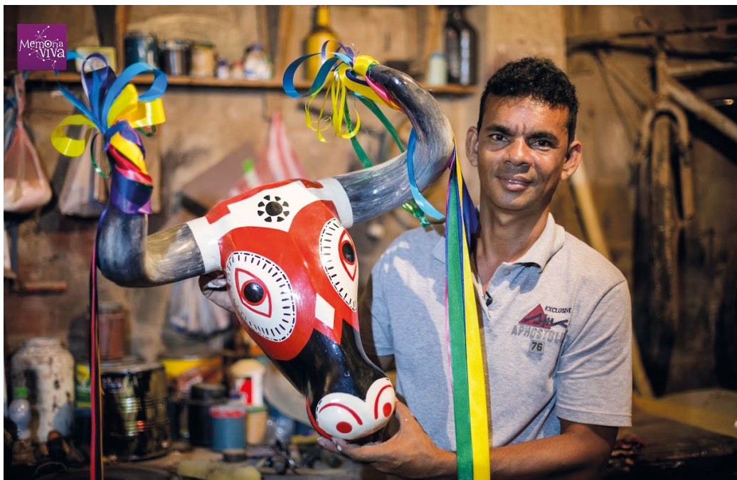
Artesano del Carnaval de Barranquilla, 2016 (Ministerio de Cultura de Colombia)

contenido. Posteriormente, se presentan dos casos de elaboración de Planes Especiales de Salvaguardia: (i) los gualíes, alabaos y levantamientos de tumba, ritos mortuorios de las comunidades afro del Medio San Juan y (ii) la Música vallenata tradicional del Caribe colombiano. Por medio de estos casos se presentan las metodologías participativas que se han incentivado en Colombia para el desarrollo de los PES a través del liderazgo de las comunidades portadoras y sobre la base de experiencias comunitarias previas de salvaguarda.